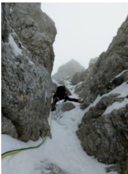
Inizio del secondo tiro