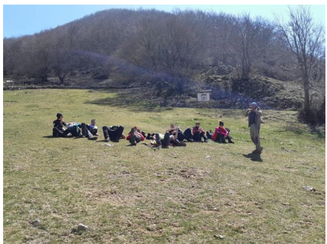
Lago del Turano

P.S. Anche questa volta il CAI VALLE ROVETO ha fatto centro. Passeggiata che tutti possiamo fare con un po' di allenamento.