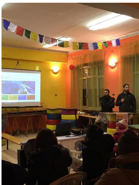
Prima serata PESCOCANALE