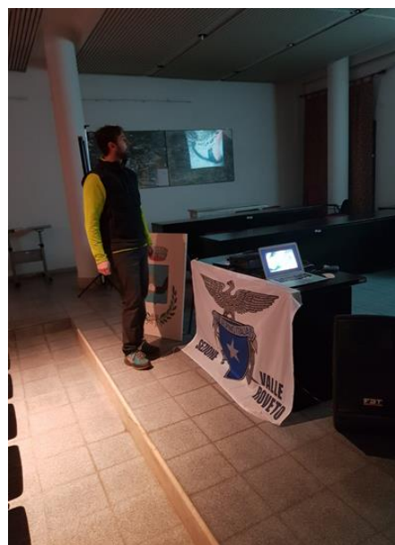
Seconda serata BALSORANO