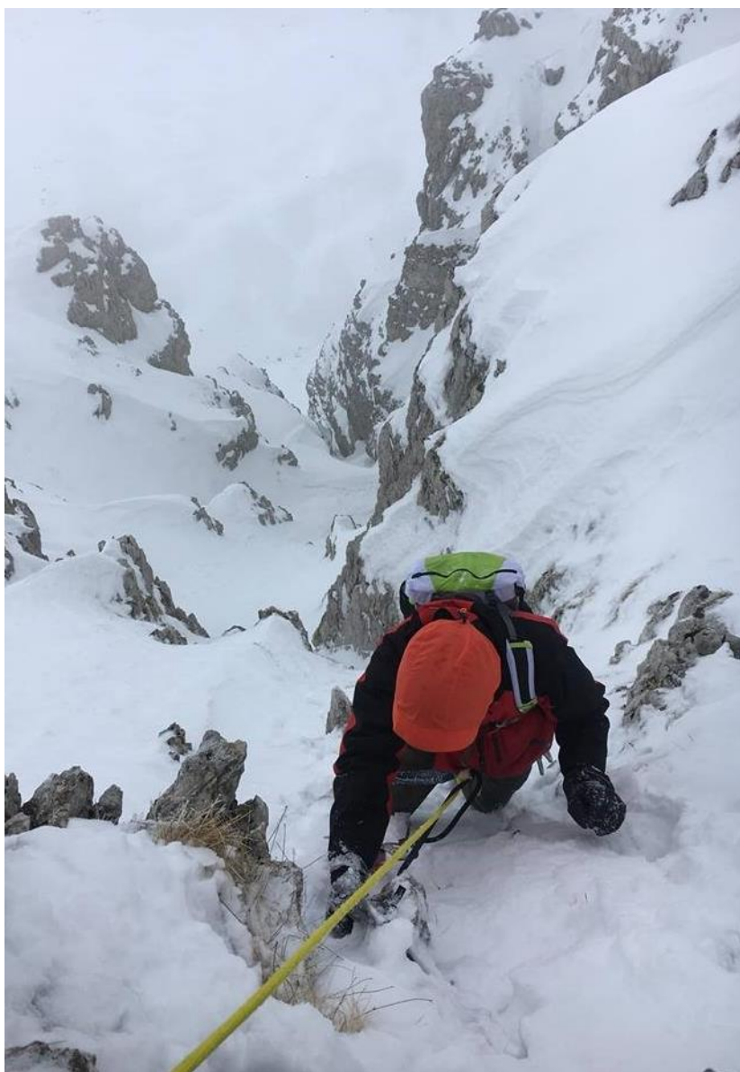
Verso l'uscita della via