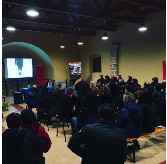
L'ultima serata CIVITA D'ANTINO